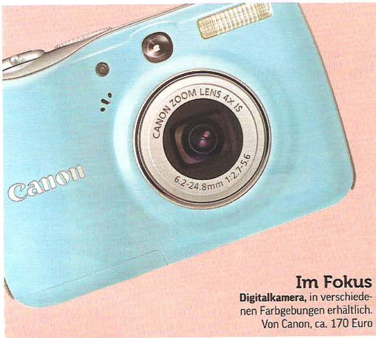
Im Fokus Digitalkamera, in verschiedenen Farbgebungen erhältlich. Von Canon, ca. 170 Euro