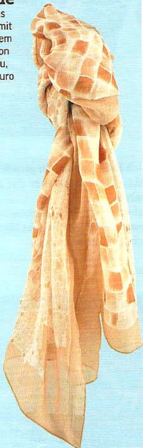
Zarte Bande Schal aus Chiffon mit grafischem Druck von Tosca Blu, ca. 70 Euro