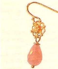
Anhänglich Ohrringe mit Blütenverzierung über feinesachen.net, ca. 35 Euro