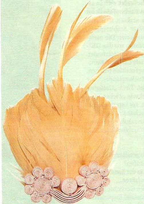
Federleicht Brosche mit schönem Pastellmix von Hoss Intropia, ca. 50 Euro