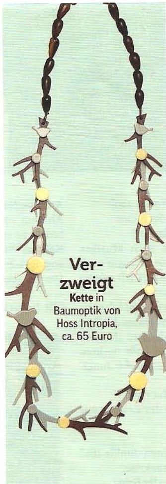
Verzweigt Kette in Baumoptik von Hoss Intropia, ca. 65 Euro